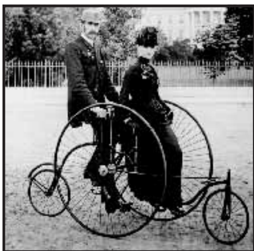
I prototipi della bicicletta si sviluppano durante l'800