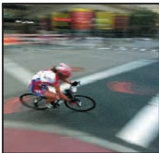
Il ciclismo rimane uno degli sport più popolari in Italia