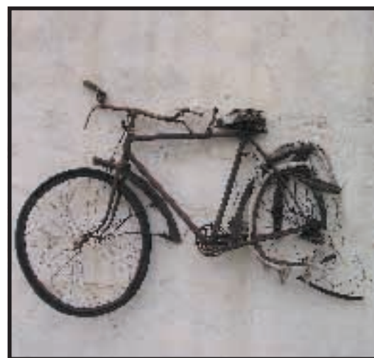
Artistica La due ruote può diventare un'opera d'arte